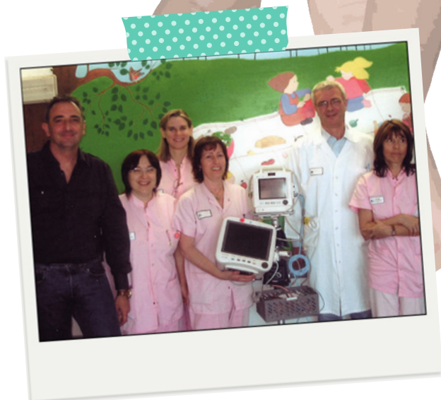
PROFESSEUR DOMINIQUE CRENESSE

Devant les difficultés financières de chacun, les fabricants de matériels offrent maintenant des appareils en modules qui peuvent se compléter régulièrement de nouvelles options ce qui permet d’étaler dans le temps les achats ou de partager les dépenses entre plusieurs associations.”