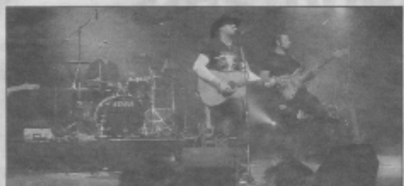
«Le blues des blancs» fait toujours recette !

La soirée «country» organisée par l'association «Sport espoir enfance» a connu un franc succès. Près de 600 danseurs sont venus danser sur leurs airs favoris et écouter le concert du groupe «Big Rock» bien connu dans le monde de la country et récompensé par la «country music awards» en 2006.